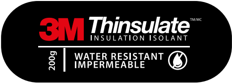
Regulador Térmico de Altas y Bajas temperaturas